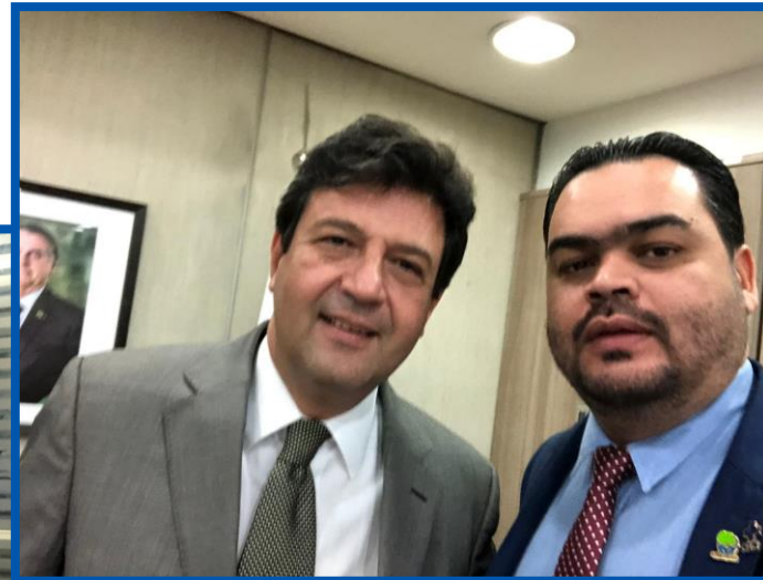
Visita ao Ministro da Saúde, Luiz Henrique Mandetta