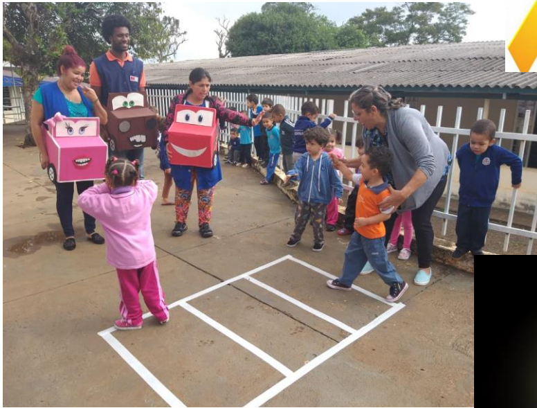
Atividade educativa em CMEI