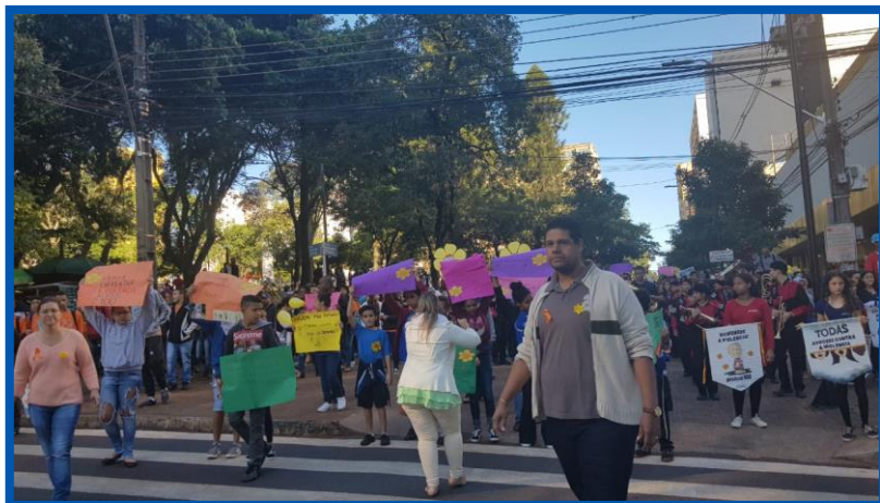
Dia Nacional de Combate à Exploração Sexual contra Crianças e Adolescentes