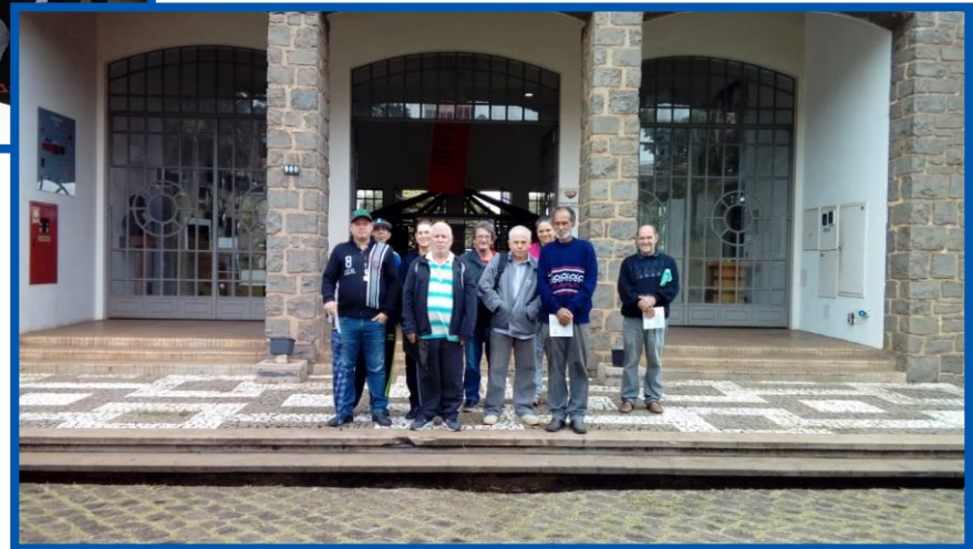
Passeio ao museu em agosto