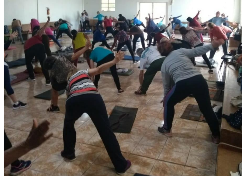
UBS San Izidro: alongamento