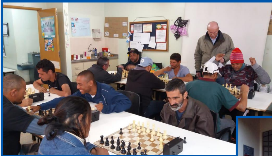
Campeonato de xadrez em julho